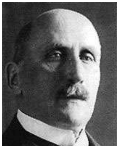
Fot. 2.42. Feliks Calonder

Komisja Mieszana była elementem uregulowania statusu Górnego Śląska w polsko-niemieckiej konwencji górnośląskiej z 15 maja 1922 roku.