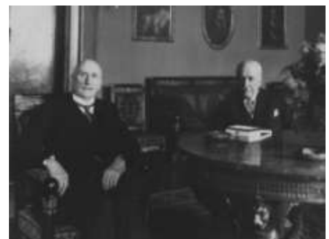
Fot. 2.44. Prezes Górnos Śląskiej Komisji Mieszanej Feliks Calonder (z lewej) podczas spotkania z prezydentem RP Ignacym Mościckim. Grudzień 1933 roku

Finansowanie działalności Komisji Mieszanej należało do obu zainteresowanych państw, przy czym wszystkie wydatki miały być ponoszone po połowie (art. 574, p. 1 KG). Wysokość budżetu została ustalona prawdopodobnie w ostatnim stadium rokowań nad konwencją genewską.