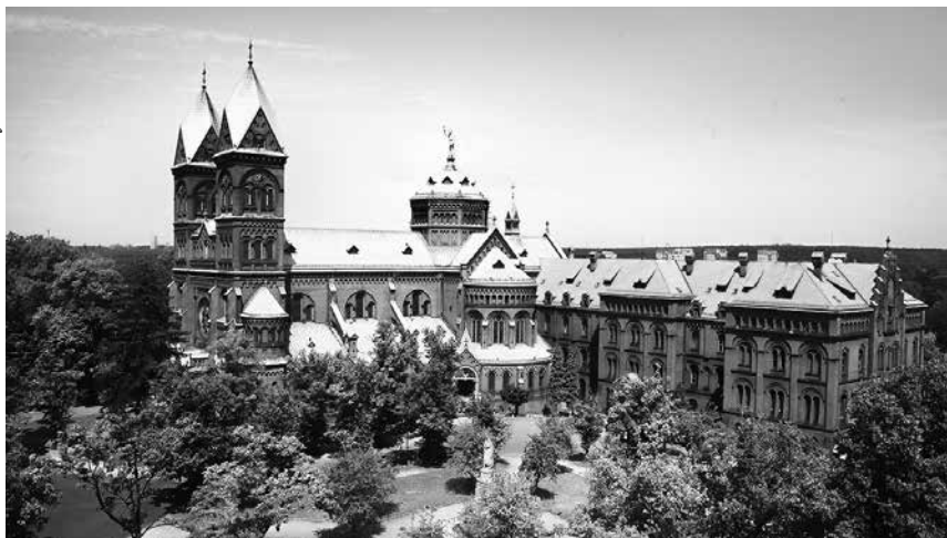
Bazylika Franciszkańska w Panewnikach