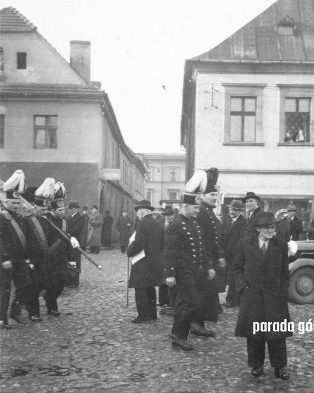
parada górnicza, Tarnowskie Góry, 4.12.1938